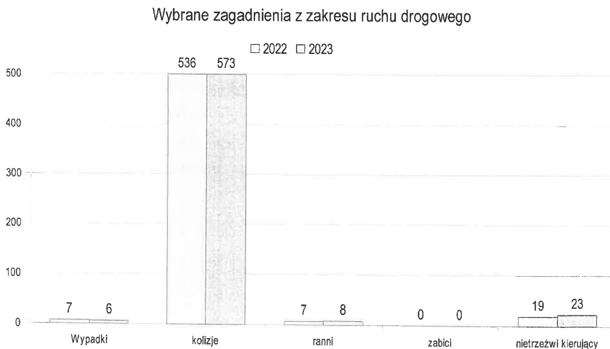
Wykres nr 2

Przedstawione dane zostały zobrazowane na wykresie nr 2.