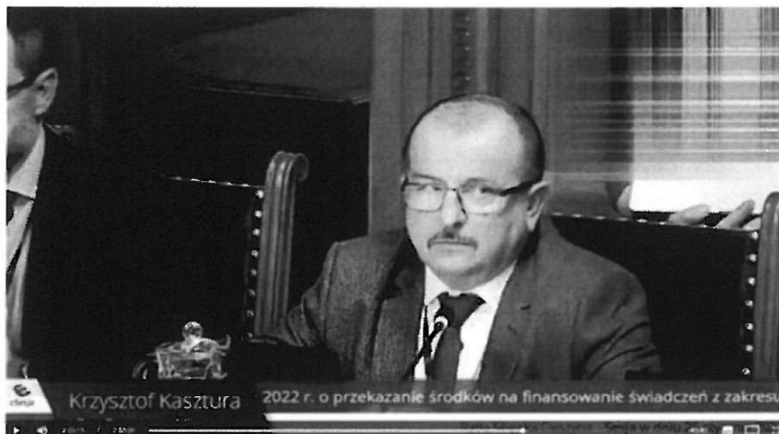
Sesja Rady Miejskiej Cieszyzna z dnia 26.01.2023

W nagraniu dostępnym po sesji ten fragment zawiera już cenzurę komunikatu widocznego na ekranie laptopa.