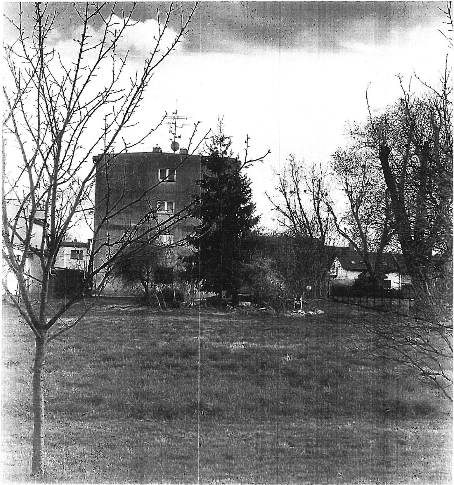
Здание в деревне