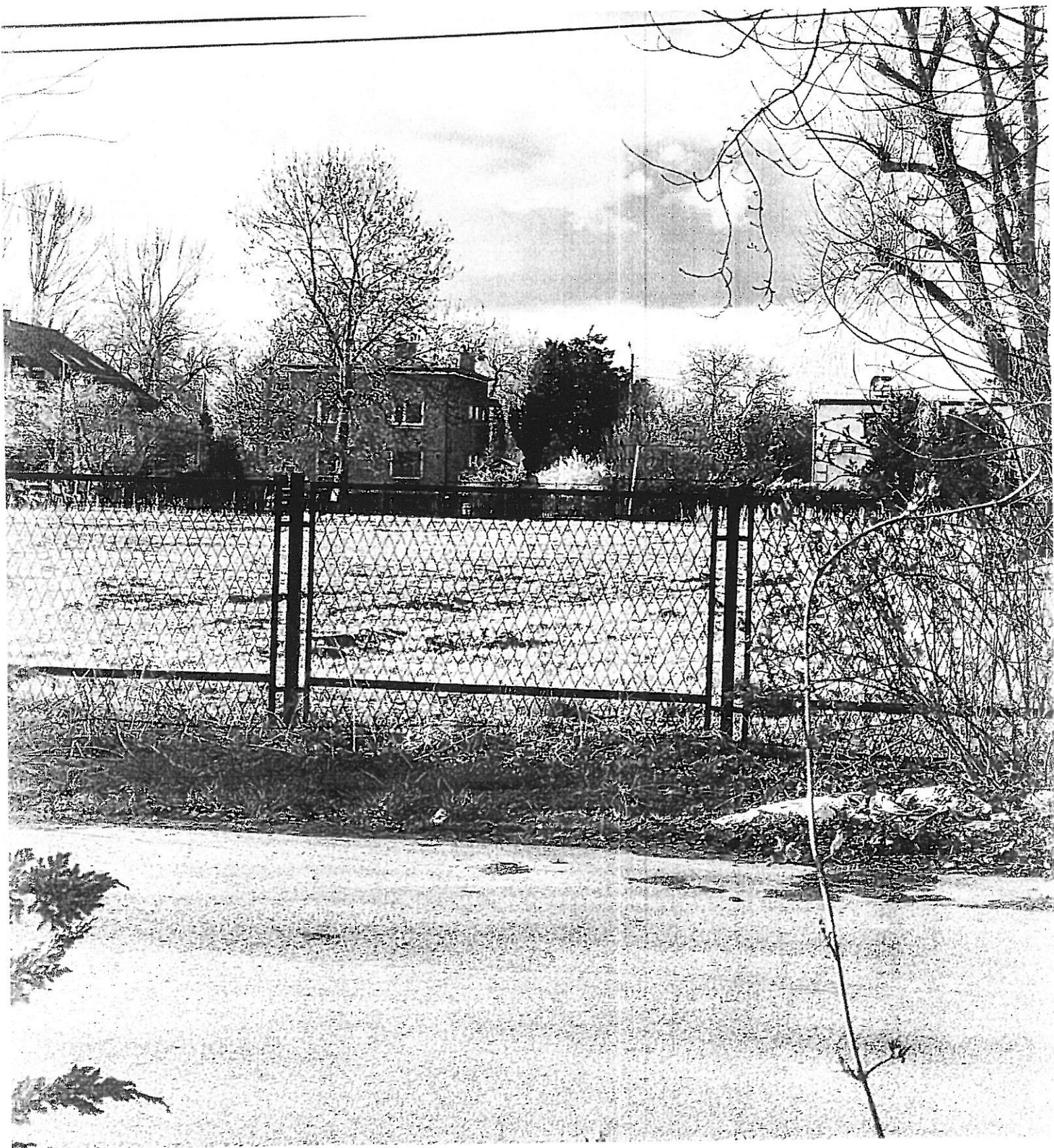
1001 5th Street, 1904 (1949)