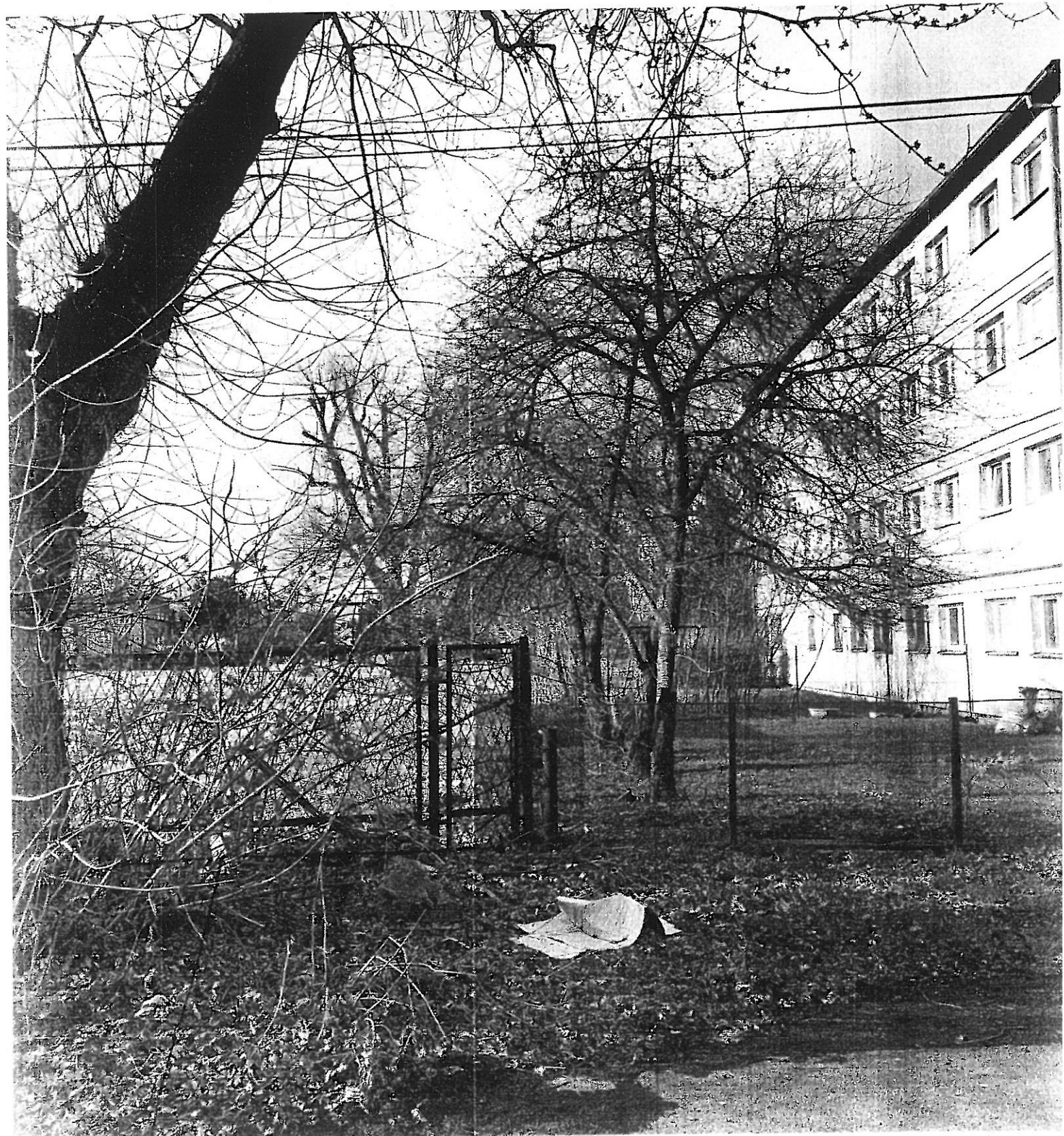
Садик в саду (1946)